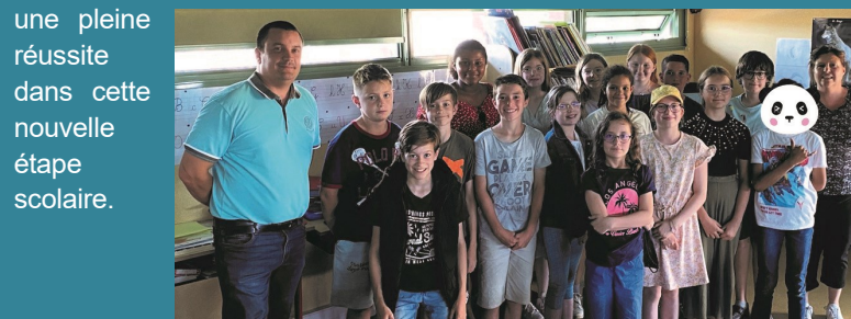
une pleine réussite dans cette nouvelle étape scolaire.

Le vendredi 23 juin, un kit de géométrie et un sac de sport ont été offerts par la Municipalité. Nous leur souhaitons une bonne rentrée et