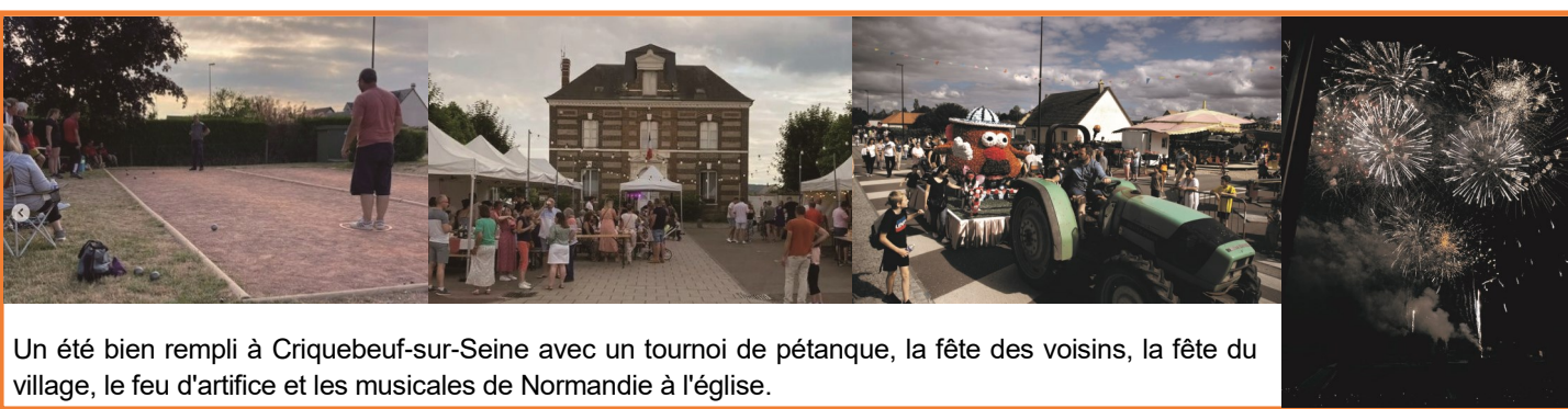
Un été bien rempli à Criquebeuf-sur-Seine avec un tournoi de pétanque, la fête des voisins, la fête du village, le feu d'artifice et les musicales de Normandie à l'église.

Coût : 333 333 € HT (225 000 € par l'Agglo et le reste à la charge de la Commune).