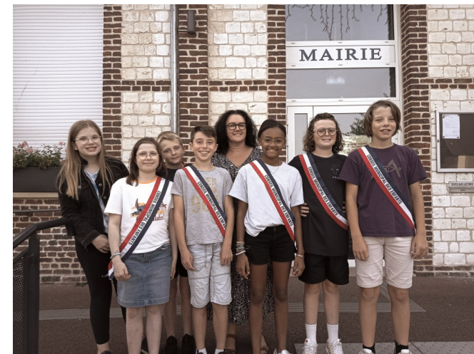
Il s'est écoulé 2 ans ...